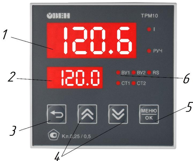
Рис. 2 Блок регулировки температуры

9.1.2 После включения прибора дисплее отобразиться информация о прошивке и предустановленная температура (п.2, Рис. 2);