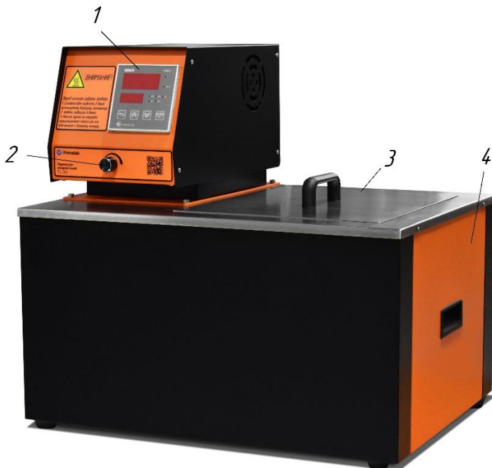
Рис. 1 Конструкция прибора

6.1.1 Внешний вид прибора показан на рисунке 1;